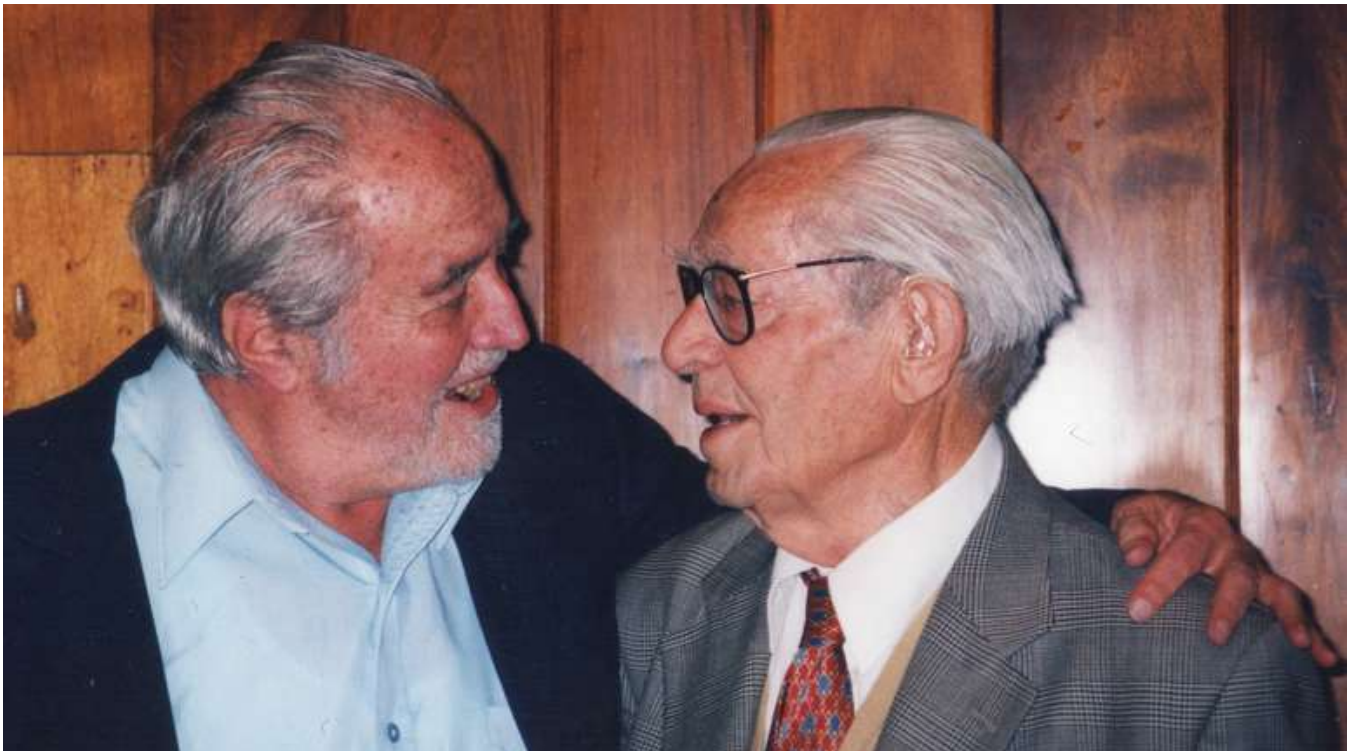
Luis Villoro, acompañando a Adolfo Sánchez Vázquez en el Homenaje por sus 90 años, en la Facultad de Filosofía y Letras de la Universidad Nacional Autónoma de México, 2005. Sostuvieron un largo debate sobre el concepto de “ideología”.

En 1974, Luis Villoro fue uno de los fundadores de la Universidad Autónoma Metropolitana y en especial, del campus Iztapalapa; de la División de Ciencias Sociales, de la cual fue su director y del Departamento de Filosofía. En esta etapa, Villoro se dedicó a promover la filosofía analítica y publicó su libro titulado: Creer, Saber y conocer (1982) que ya cuenta con numerosas ediciones.