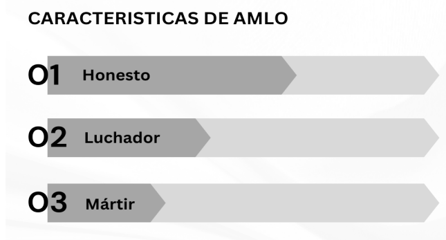
Gráfico 1. Características hacia la figura de Andrés Manuel López Obrador.

La elección del 1 de julio favoreció al candidato Andrés Manuel López Obrador, quien con el 53.17 % (30 millones de votos) a su favor se convirtió en el presidente de México (INE,2018). La toma de protesta se dio en una ceremonia inusual, por primera vez la plancha del Zócalo capitalino se llenó de miles de simpatizantes que esperaban ansiosamente la llegada del presidente. En una ceremonia donde estuvo presente un grupo de representantes de los 68 pueblos indígenas, se realizó un ritual de purificación donde se le otorgó el bastón de mando con la siguiente frase “Aquí está el bastón de mando, el símbolo con el que usted conducirá a nuestro pueblo. Queremos recordarle que deseamos ser tomados en cuenta en sus planes